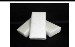
ドライアイス処置