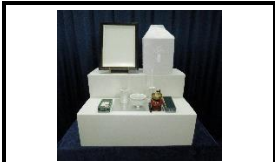
後飾り祭壇・仏具